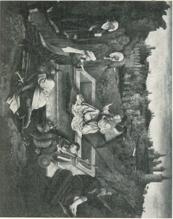
Schilderij Museum Boymans-v. Beuningen, Rotterdam.

Een handige tip die u gaf voor het vergroten van de capaciteit van de zuigergerepen.